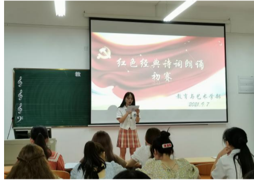
▲教育与艺术学部诗歌朗诵初赛现场

(教育与艺术学部)为弘扬中华优秀传统文化,激发当代大学生对中华诗词的认同与热爱,引导青年学子以诗歌为载体学习感悟百年党史,同时提高同学们的专业技能,营造良好的文化氛围,丰富大学课余生活,2021年9月7日晚18:30,教艺术学部于实验楼一栋406多媒体教室举办红色经典诗词朗诵活动。