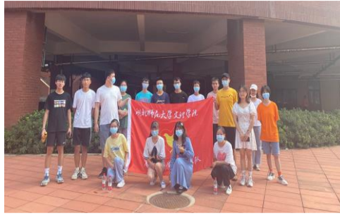
▲高职一学部迎新志愿者合影

晚上七点,活动开始。首先,全体起立,所有与会同学齐唱中国共产主义青年团团歌。随后,各班主持人带领同学们回顾了党的光辉革命奋斗历史,讴歌了党的百年丰功伟绩。最后,同学们观看习近平总书记“七一”讲话相关视频,进一步激发同学们的爱国奋斗热情。活动过程中氛围热烈,大家积极讨论并