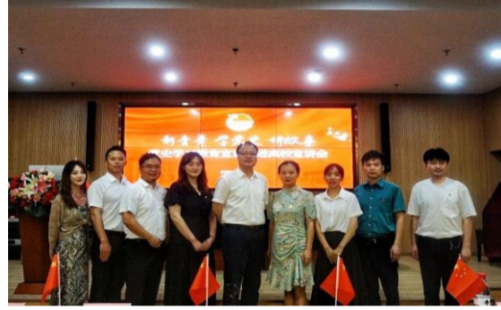
▲领导嘉宾们合影留念

教育动员大会上的重要讲话精神,促进了我校学子理想信念的坚定与思想共识的凝聚,展现出我校对党史学习教育的走深走实、入脑入心。